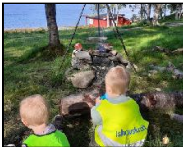
«Bål hører ofte med på tur»