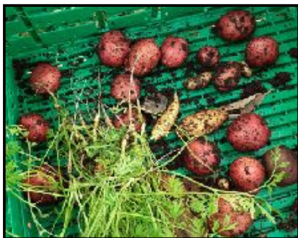
« Egen dyrkede poteter »

Gjennom arbeid med fagområdet skal barna få mulighet til å sanse, oppleve, leke, lære og skape med kroppen som utgangspunkt. Gjennom medvirkning i mat- og måltidsaktiviteter skal barna motiveres til å spise sunn mat og få grunnleggende forståelse for hvordan sunn mat kan bidra til god helse.