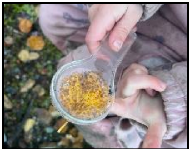
«Undersøkelse av blader med forstørrelsesglass»