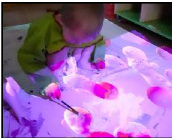
«projektor og maling»

«I barnehagen skal barna oppleve et stimulerende miljø som støtter opp om deres lyst til å leke, utforske, lære og mestre. Barnehagen skal introdusere nye situasjoner, temaer, fenomener, materialer og redskaper som bidrar til meningsfull samhandling. Barnas nysgjerrighet, kreativitet og vitebegjær skal anerkjennes, stimuleres og legges til grunn for deres læringsprosesser. Barna skal få undersøke, oppdage og forstå sammenhenger, utvide perspektiver og få ny innsikt. Barna skal få bruke hele kroppen og alle sanser i sine læringsprosesser. Barnehagen skal bidra til læringsfellesskap der barna skal få bidra i egen og andres læring». (R17 s. 22)