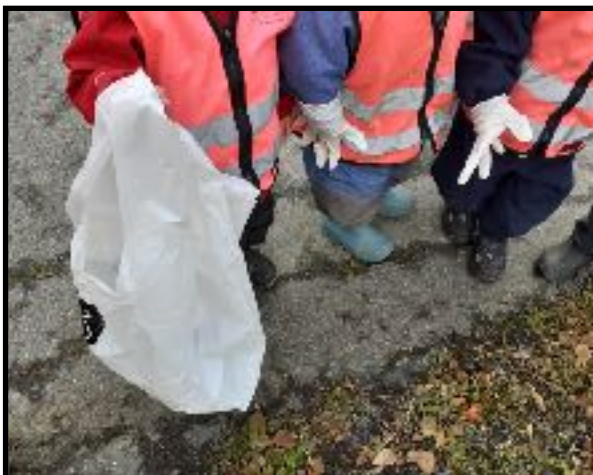
«Vi tar vare på naturen med å hjelpe til med å plukke søppel»

Nærmiljøet gir muligheter for ulike erfaringer i forhold til å lære om samspill i naturen og mellom mennesket og naturen, slik at vi kan bevare et biologisk mangfold og bidra til bærekraftig utvikling.