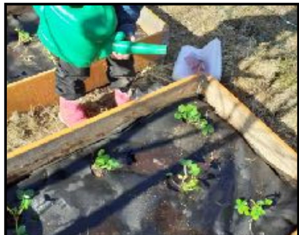
«Vi steller plantene våre»