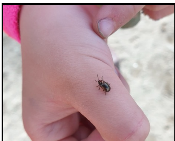
«Hvem er dette?»

«I barnehagen skal barna oppleve et stimulerende miljø som støtter opp om deres lyst til å leke, utforske, lære og mestre. Barnehagen skal introdusere nye situasjoner, temaer, fenomener, materialer og redskaper som bidrar til meningsfull samhandling. Barnas nysgjerrighet, kreativitet og vitebegjær skal anerkjennes, stimuleres og legges til grunn for deres læringsprosesser. Barna skal få undersøke, oppdage og forstå sammenhenger, utvide perspektiver og få ny innsikt. Barna skal få bruke hele kroppen og alle sanser i sine læringsprosesser. Barnehagen skal bidra til læringsfellesskap der barna skal få bidra i egen og andres læring». (R17 s. 22)