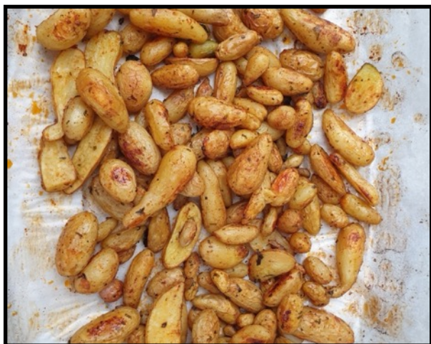
«Egen dyrkede poteter smaker godt»

motiveres til å spise sunn mat og få grunnleggende forståelse for hvordan sunn mat kan bidra til god helse.