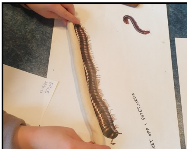
«Sammenligning av lengde»

digitale verktøy kan være en motivasjonsfaktor for matematisk tenkning. Det handler også om å stille spørsmål, resonnere, argumentere og søke løsninger.