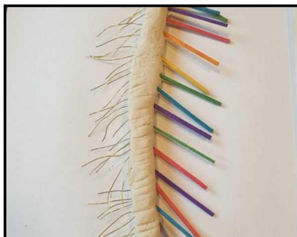
«Har tusenbeinet tusen bein?»