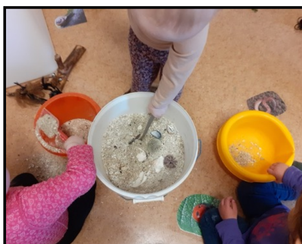
«Fjæra sanda tas med inn for lek, sansing og undring»

Vår pedagogikk bygger på den oppfatning at barn lærer gjennom daglige situasjoner, der det er rom for å utforske og undre seg og se sammenhengen i det vi gjør. Barn lærer gjennom lek og samspill med andre barn og voksne, og ved å uttrykke seg gjennom bruk av ulike materialer. Barna har en iboende vilje og forutsetning for hele tiden å lære og utvikle seg. Barnet lærer gjennom bearbeiding av opplevelser og erfaringer som skjer i lek og samspill med andre barn og voksne. Meningen blir skapende i pennestrøket og i formingen av leiren eller i leken.