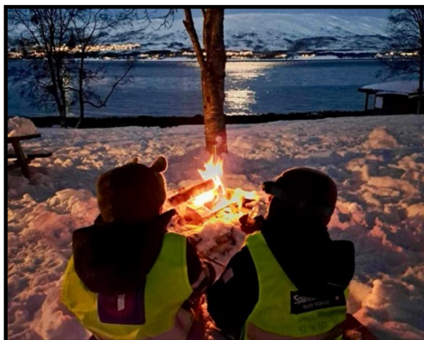
«Bål hører ofte med på tur»